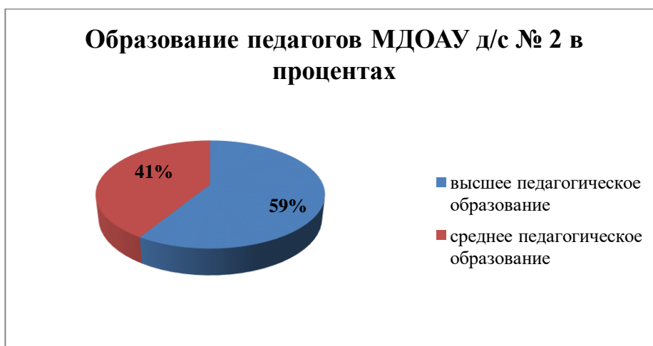
Гистограмма. Образование педагогов МДОАУ д/с № 2 г. Свободного

Образование педагогов. Работу с детьми осуществляют 17 педагогов, из них высшее образование – 10 человек (58,8%), среднее профессиональное (педагогическое, специальное) образование - 7 человек (41,2%).