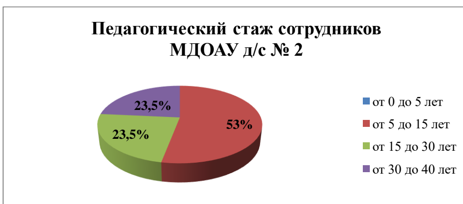
Гистограмма. Педагогический стаж педагогов в количественном соотношении

Педагогический стаж педагогов ДООУ осуществляющих образовательный процесс: до 5 лет - 0 педагогов, от 5 до 15 лет – 9 педагогов, от 15 до 30 лет - 4 педагога, свыше 30 лет – 4 педагога.